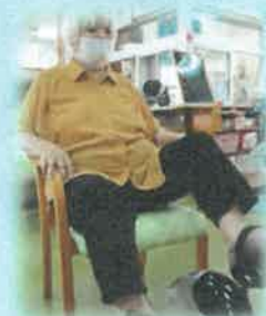
個別機能訓練・物理療法