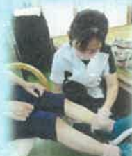
馬油マッサージ・囲碁