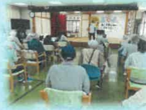
足踏み運動 (集団体操)