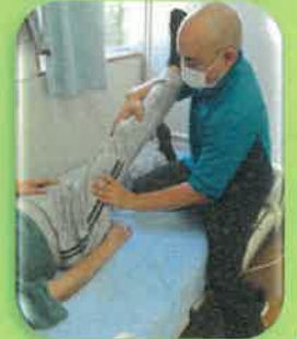
個別機能訓練・物理療法