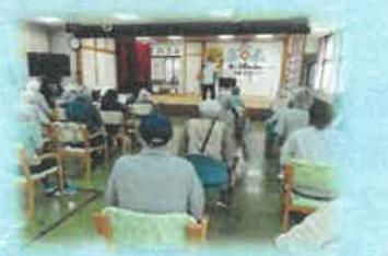
足踏み運動 (集団体操)