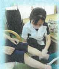
馬油マッサージ・囲碁