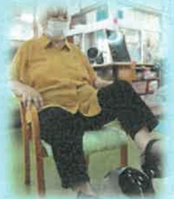
個別機能訓練・物理療法