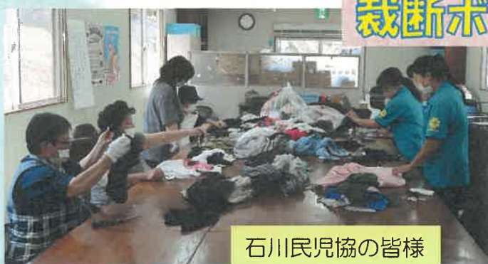
石川民児協の皆様