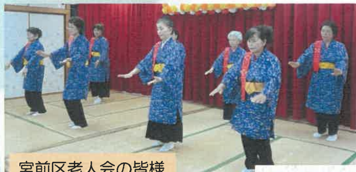
宮前区老人会の皆様