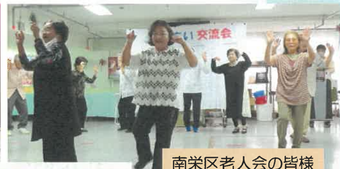
南栄区老人会の皆様