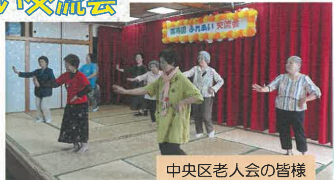
中央区老人会の皆様

コロナ過で中止していたふれあい交流会を今年度から再開して、6カ所の老人会と子供会に来園してもらい踊りやエイサー、カラオケ等の余興で利用者を盛り上げて頂きました！ありがとうございました。