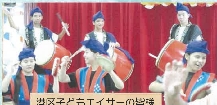
港区子どもエイサーの皆様