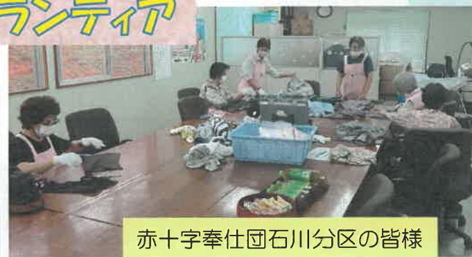
赤十字奉仕団石川分区の皆様