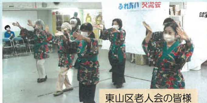
東山区老人会の皆様