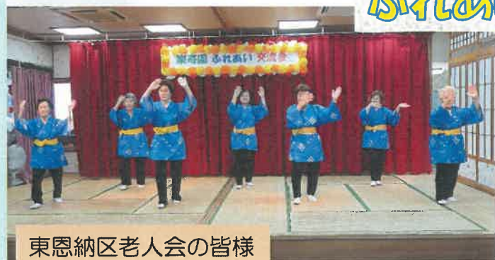
東恩納区老人会の皆様