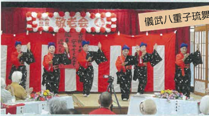
儀武八重子琉舞道場の皆様